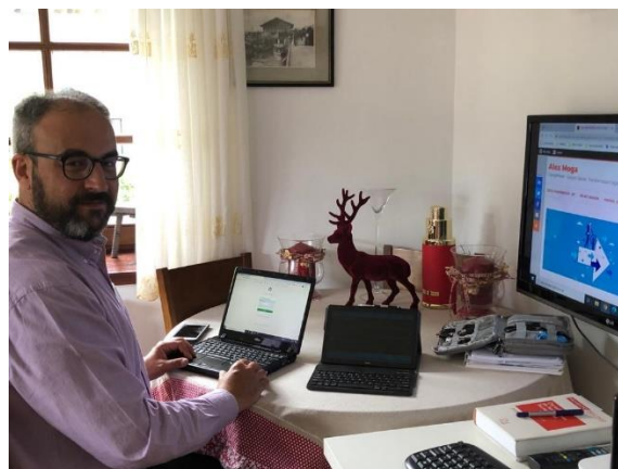
(Imagen de mi despacho, situado en el salón)

Tal y como he explicado anteriormente, después de muchos años haciendo de la tecnología mi cómplice para saltar el obstáculo de la distancia (desde el Valle de Aran es una obligación para el progreso), sin buscarlo explícitamente, un día me di cuenta de que ya no necesitaba el papel para mi cotidianidad. Hoy, desde todas mis ópticas, el papel ya no va conmigo.